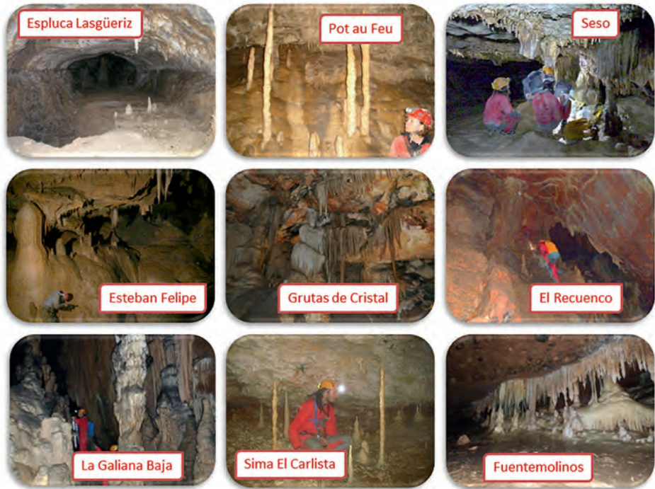
Figura 2. Fotos de las cuevas de estudio donde se aprecian algunas características generales de las cavidades y diferentes tipos de espeleotemas.

contenido de ^{238}\text{U} sea suficiente para realizar el análisis, (2), que el sistema haya permanecido cerrado tras la precipitación del carbonato impidiendo posteriores incorporaciones de U o Th y (3), que no haya un importante contenido en Th de origen detrítico (el ^{230}\text{Th} suele aparecer asociado normalmente a las arcillas). La primera premisa es necesaria forzosamente ya que si la cantidad de U en la muestra se encuentra por debajo de los límites de detección del espectrómetro será imposible la datación, mientras que la segunda y tercera premisa están más relacionadas con la obtención de la verdadera edad de la muestra, ya que si el sistema ha estado abierto a fuentes de U o bien, el contenido en detrítico es alto en el carbonato, el error generado puede ser excesivamente elevado.